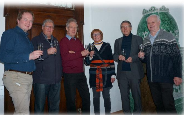
Zurzeit bestehende Arbeitsgruppe