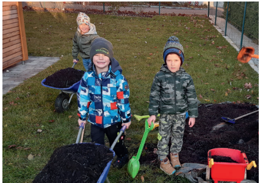
Die Kinder halfen fleißig bei der Befüllung der Hochbeete mit.

Ein großes Dankeschön gilt auch den Windhaager Burgdämonen, die uns mit Nikolaussackerl für alle Kinder überrascht haben.