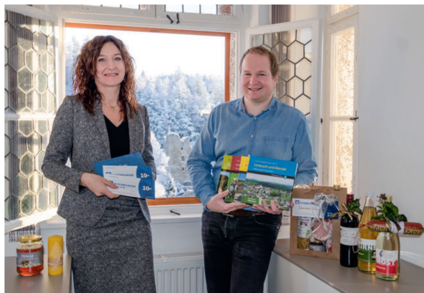
Regionale vielseitige Geschenkideen

Weiters sehr zu empfehlen ist der heuer erschienene 4. Band der WINDHAAGER HEIMATBUCHREIHE mit dem Titel "Umbruch und Wandel"! Das Buch ist die perfekte Lektüre für